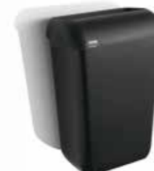
afvalbak 43 liter, 180260