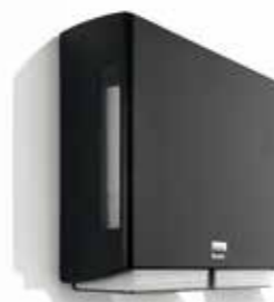
BriQ double, 180306