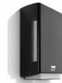
BriQ single, 180305