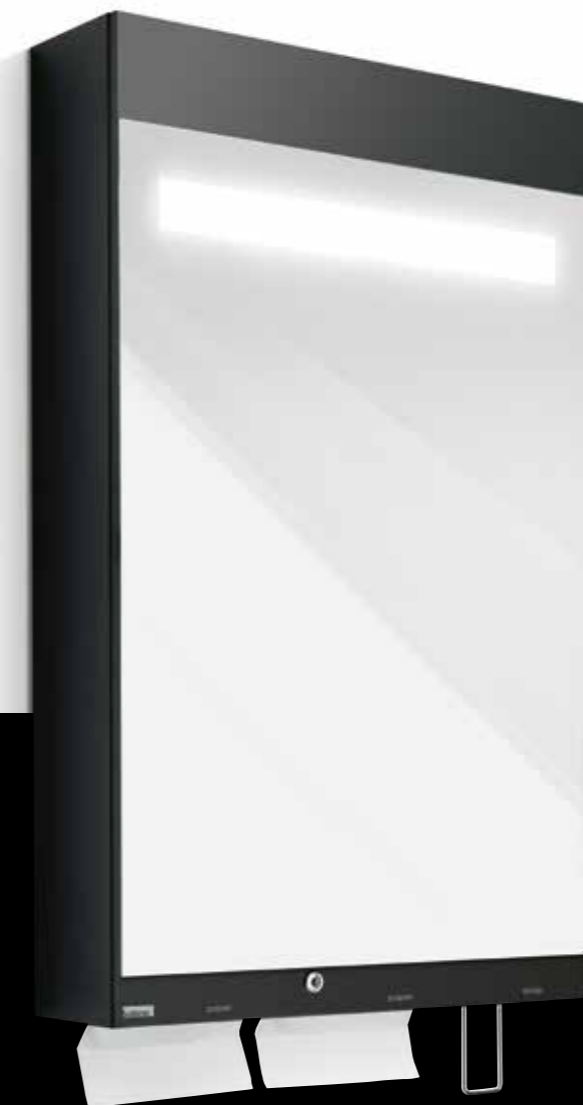
Satino Multi Mirror met LED-verlichting, 180513

Het Multi Mirror concept is een alles-in-één concept voor handreiniging, handdroging, luchtverfrissing en verlichting. Het moderne design van de spiegelkast in combinatie met de subtiele, energiezuinige verlichting maken een visitekaartje van uw toiletruimte. De ruim ingebouwde capaciteit voor handdoekpapier maakt deze multi-purpose spiegel ook geschikt voor toiletruimtes met hoge bezoekersaantallen of piekbezoekuren.