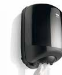
poetsroldispenser midi, 180851