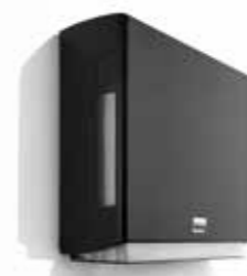
BriQ towel, 180308